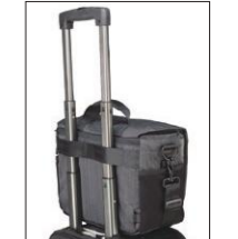
カート取付用ルーフ付(DNA8除く)