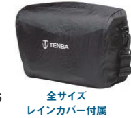
全サイズレインカバー付属