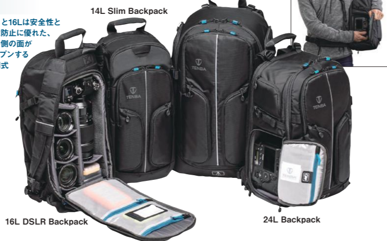
16L DSLR Backpack

632-432(021265) 内寸(約):28(幅)×28(高さ)×48(奥行)17cm 外寸(約):30(幅)×30(高さ)×53(奥行)28cm 重量(約):2.7kg フロント+サイド7ヶ所タイプ