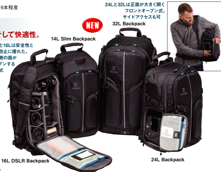
16L DSLR Backpack

SHOOTOUT 32L Backpack シュートアウト 32L バックパック ¥46,200 632-432(021265) 内寸(約)/(幅)28×(高さ)48×(奥行)17cm 外寸(約)/(幅)30×(高さ)53×(奥行)28cm 重量(約)/2.7kg フロント+サイドアクセスタイプ