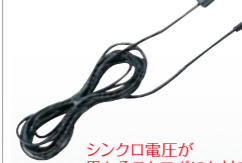
シンクロ電圧が異なるストロボにも対応(電圧調整回路付)