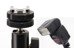
ボールヘッドとシューが一体に