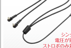
シンクロ電圧が同じストロボのみ対応