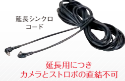
延長用につきカメラとストロボの直結不可