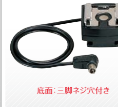
底面:三脚ネジ穴付き