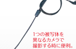
1つの被写体を異なるカメラで撮影する時に便利。